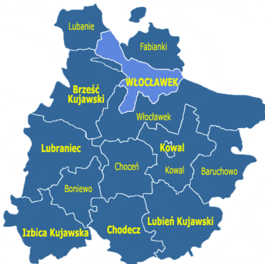
Rysunek 1. Położenie Gminy Choceń w powiecie włocławskim

Gmina położona jest w północnej części województwa kujawsko-pomorskiego. Gmina graniczy: z gminami – Boniewo, Chodecz, Kowal, Lubień Kujawski, Lubraniec, Włocławek