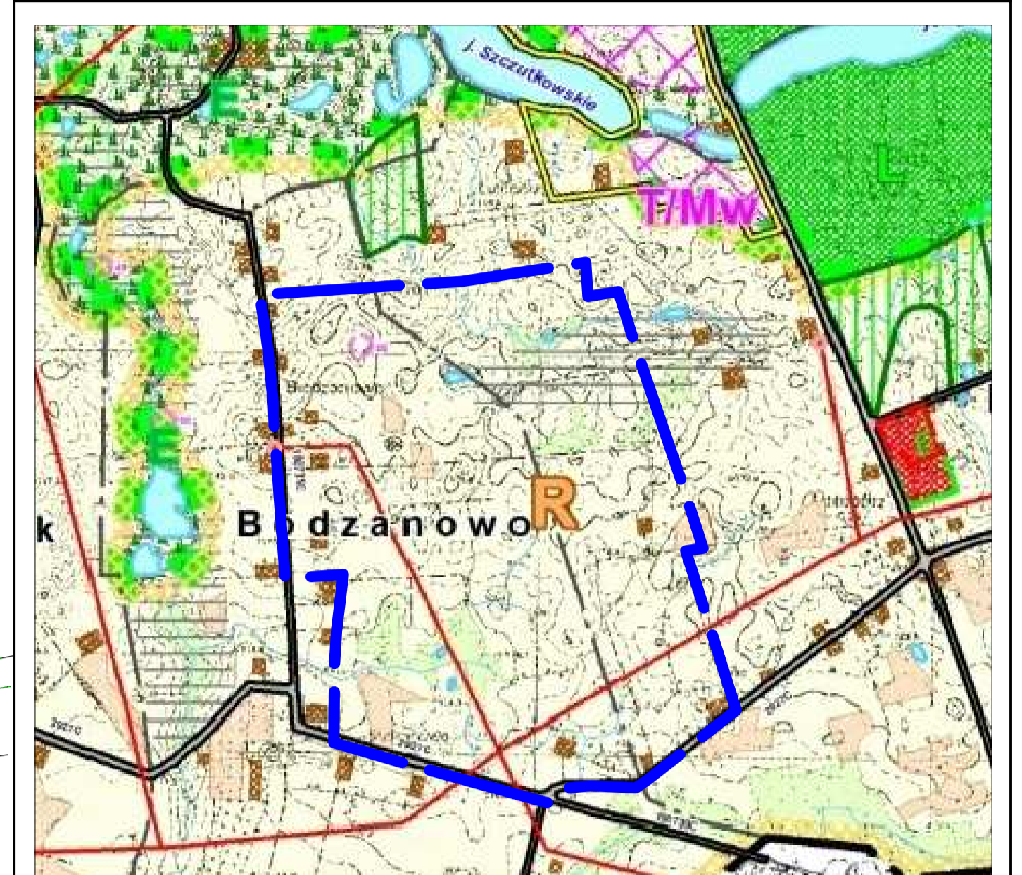
GRANICA OBSZARU OBJĘTEGO OPRACOWANIEM